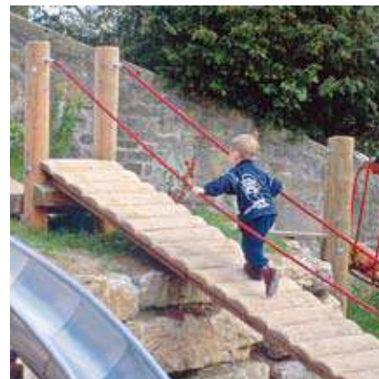
Réf. 3.66327 - Pont de 3 m de long avec main-courante en câble Corocord®

C'est ainsi que ces éléments de liaison rigides satisfont l'un des critères qui nous tient le plus à coeur : stimuler et maintenir en éveil tous les sens des enfants.