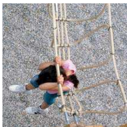
Ponts de cordes