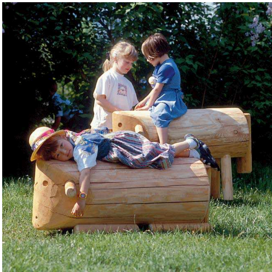
Mouton debout Mouton allongé