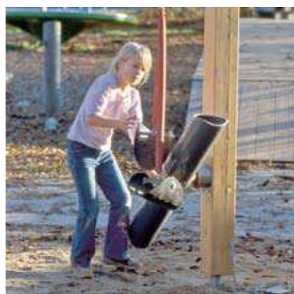
Systèmes de Transport de sable à raccorder sur structure existante