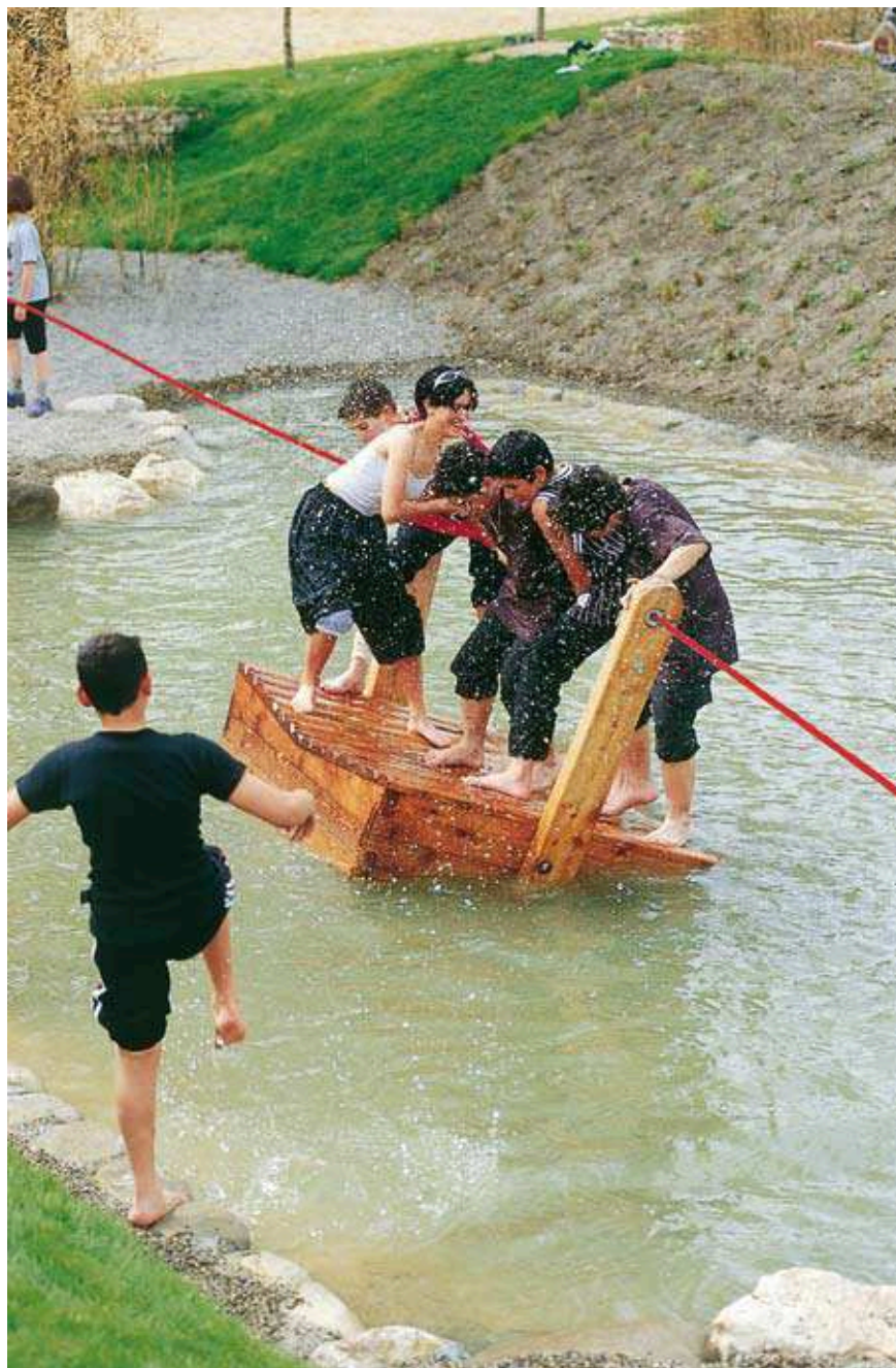
Bac à traile