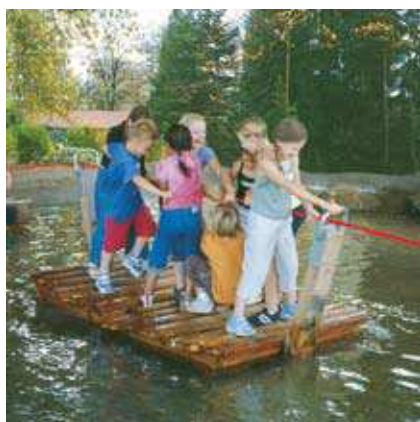
Bac à traile, modèle standard, avec orifices de guidage des cordes en acier inox