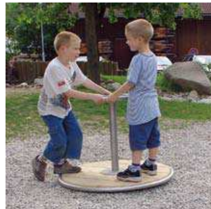
Réf. 6.26500 La Plate-forme tournante

Les enfants adorent jouer sur les tourniquets. La Plateforme tournante et le Petit Carrousel leur donne l'occasion d'expérimenter pour la première fois quelques principes physiques simples comme la force centrifuge, la vitesse de rotation et la force nécessaire pour mener le tout ! Les activités physiques sont développées à cette occasion. Les principes de cause à effet sont appris simplement, graduellement. Les limites physiques peuvent être testées à cette occasion. Ces deux équipements encouragent la communication et la coopération entre enfants.