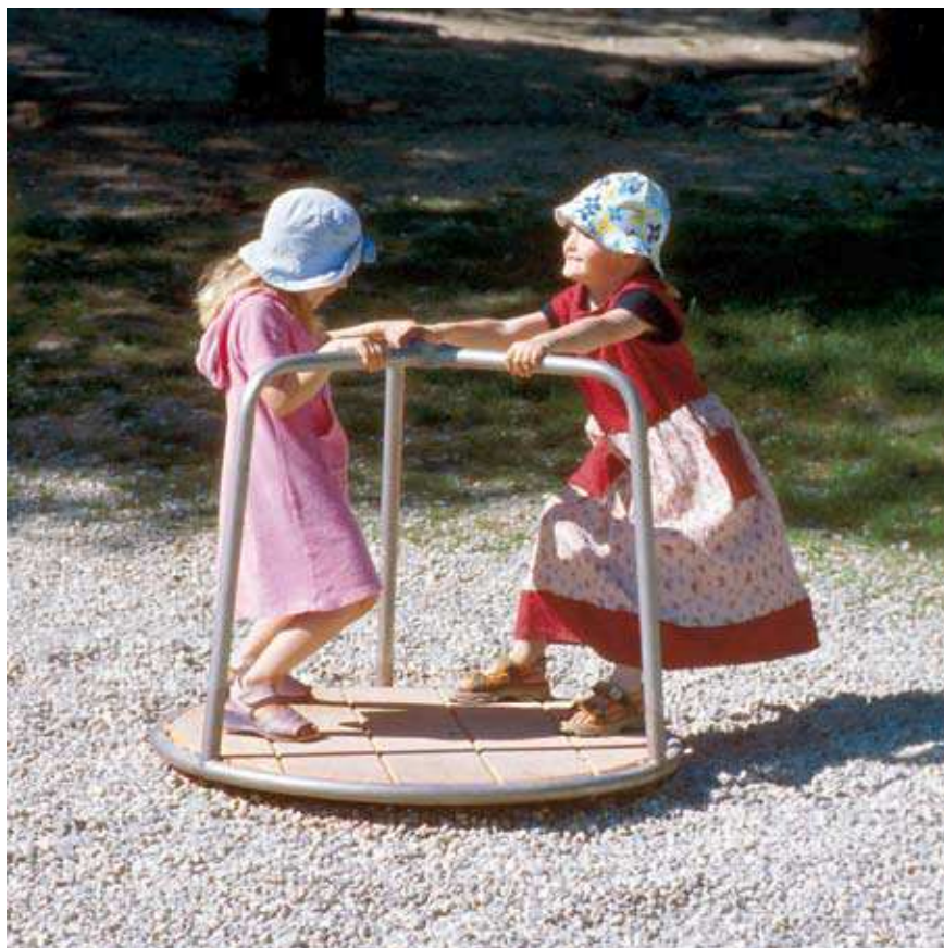
La Plate-forme tournante Le petit Carrousel