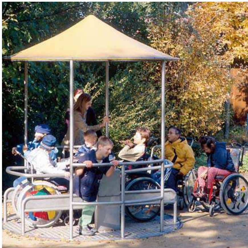
Tourniquet pour fauteuil roulant