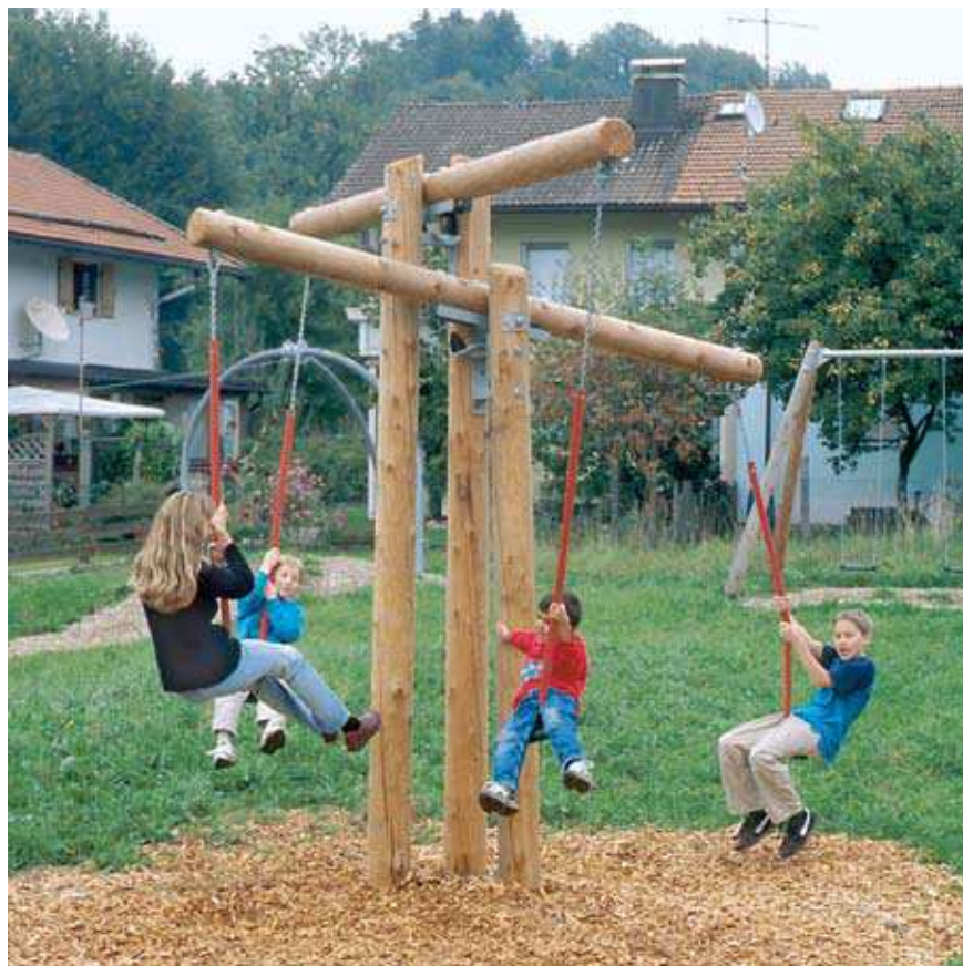
Balance Balance en croix