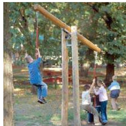
Réf. 6.10000 Balance