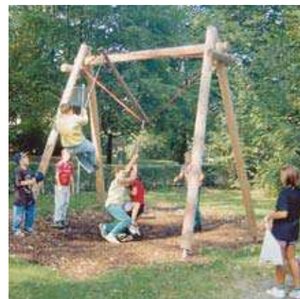
Réf. L6.10200 Le Balancier

Ce portique à balancier, qui permet aux enfants de bouger de mille manières est un enrichissement original de l'offre ludique sur une aire de jeux. Les enfants deviennent en quelque sorte le poids du balancier et font ainsi des expériences de phénomènes physiques tout en s'amusant. Avec le Balancier, les enfants peuvent tout aussi bien se laisser bercer doucement à plusieurs que se déchaîner en s'élançant avec force et énergie ; c'est pourquoi il convient également très bien aux adolescents.