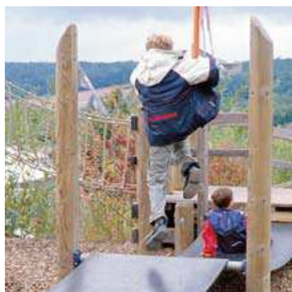
Le Pont Trampoline Le Pont Trampoline, avec renforts d'ancrage