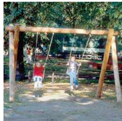
Réf. 6.12800 La Balançoire jumelle

Nos balançoires sont également disponibles en version bois intégralement non traité, avec une traverse de support métallique.