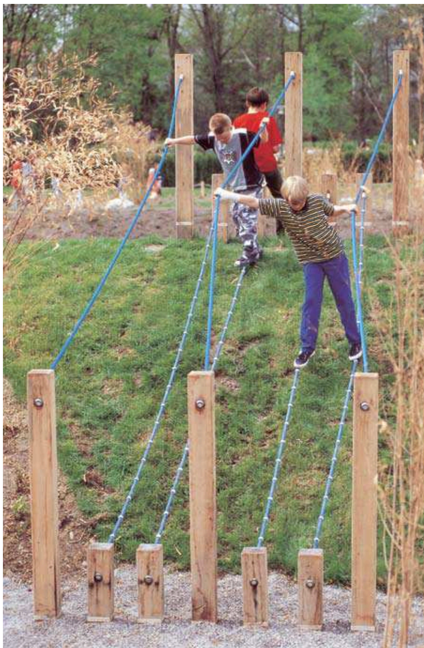
Cette photo montre un élément de base (Réf.L6.51800) et un élément d'attache (Réf.L6.51805) avec des poteaux de support en bois de chêne.