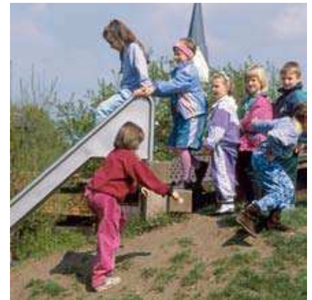
Cadre de support avec marche pour implantation sur butte : Réf. 3.65200