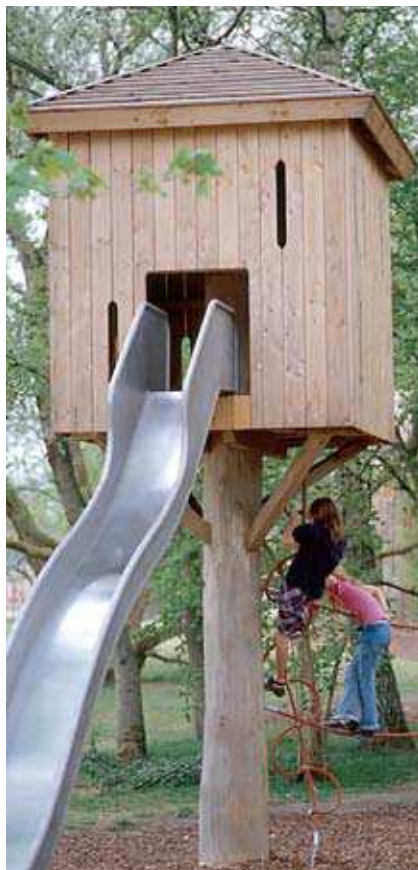
Glissière à une vague et protections latérales surélevées : Réf. 3.63225 (haut de raccordement 3,00 m)