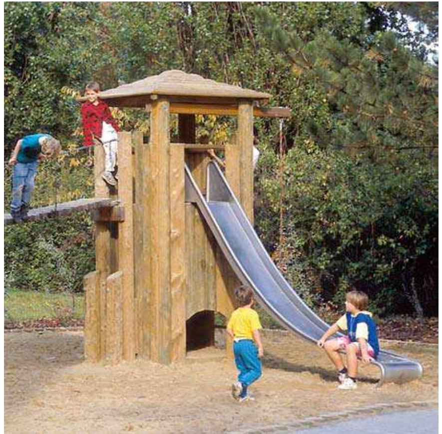
Glissières Toboggans inox