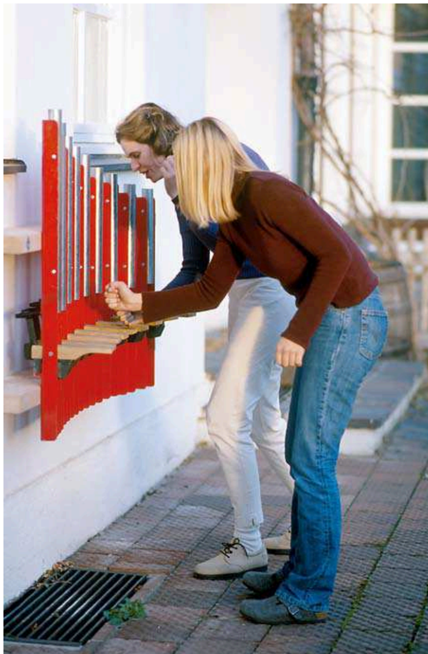
Le Mur sonore