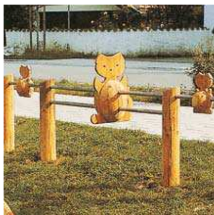
Réf. 4.84530 - Barrière Chats

Barrière Oursons Barrière Lapins Barrière Chats