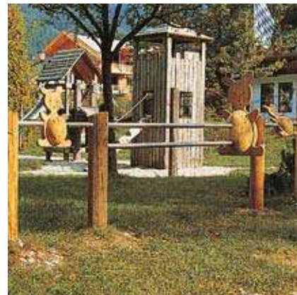
Réf. 4.84330 - Barrière Lapins